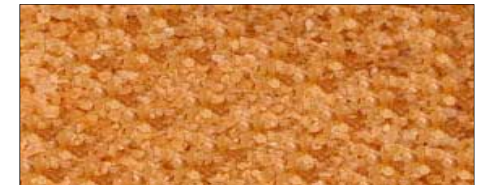
Rotes Aleae Hawaii Salz