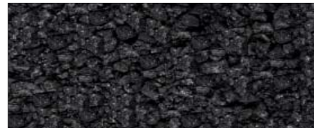
Schwarzes Hawaii Salz