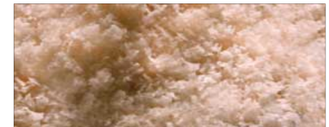
Murray River Salz