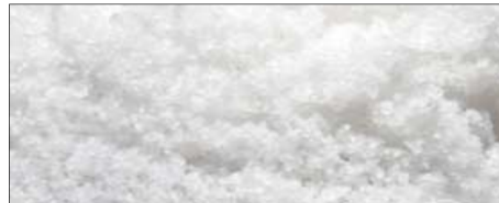
Fleur de Sel de Camargue