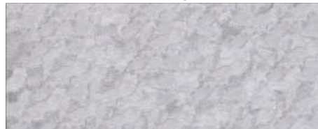
Weisses Hawaii Salz