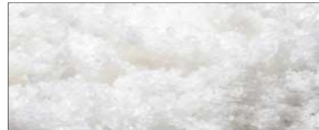
Fleur de Sel de Ile de Re