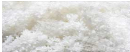
Fleur de Sel de Guerande

Gourmet Salze aus aller Welt. Seit Jahrtausenden spielt Salz eine große Rolle. Fast alle Kulturen auf fast allen Kontinenten schätzen Salz als Nahrungsmittel. In einigen wurde es auch zum Gourmet Salz, dass bei keiner Speise fehlen darf. Noch heute werden die meisten Gourmet Salze aufwendig von Hand gewonnen. Vom Fleur de Sel, über das Meersalz bis hin zu Steinsalz oder dem Rauchsalz. Gourmet Salze gibt es heute in den verschiedensten Variationen und reichen vom feinen und milden bis hin zum äußerst salzigem Geschmack oder von der weichen bis zur knusprigen Konsistenz.