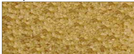
Grünes Bambus Hawaii Salz