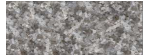
Fleur de Sel de Noirmoutier